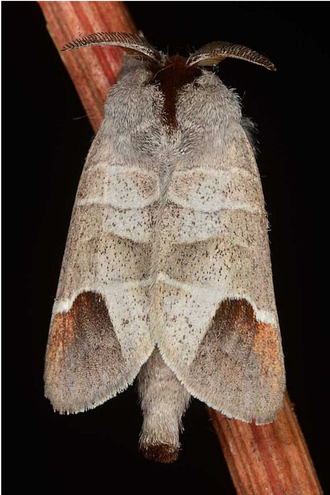
Clostera curtula (Linnaeus, 1758)