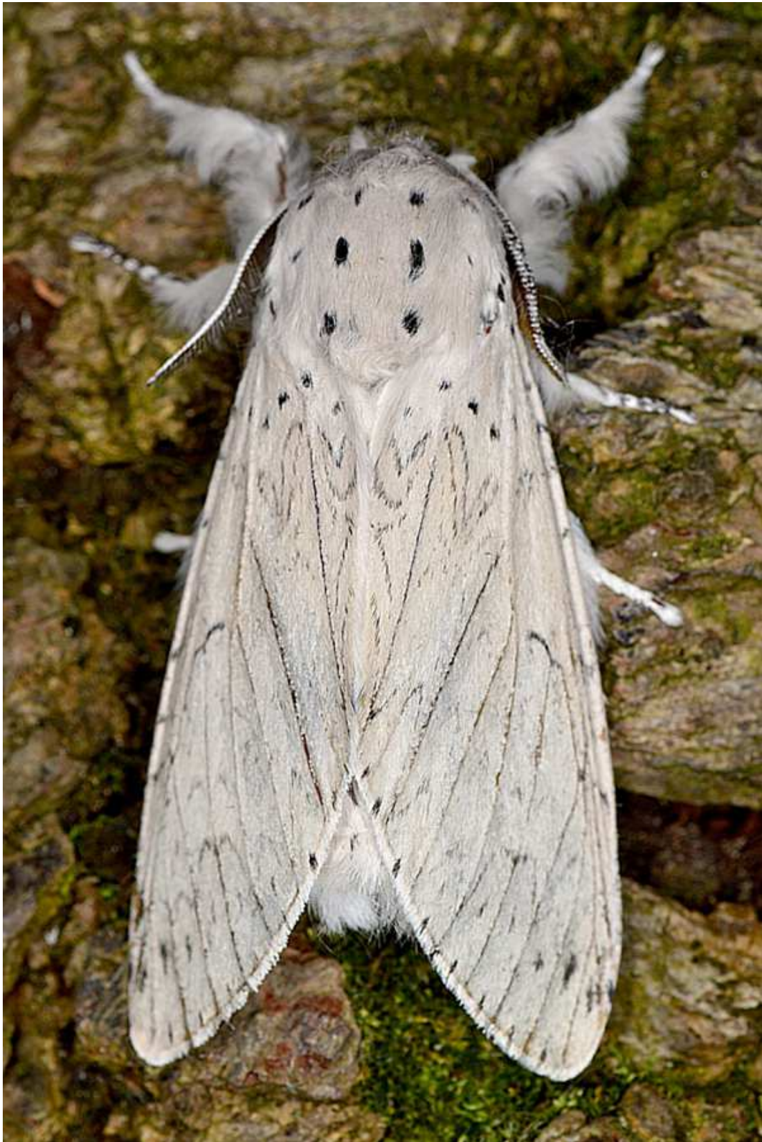
Cerura erminea (Esper, 1783)