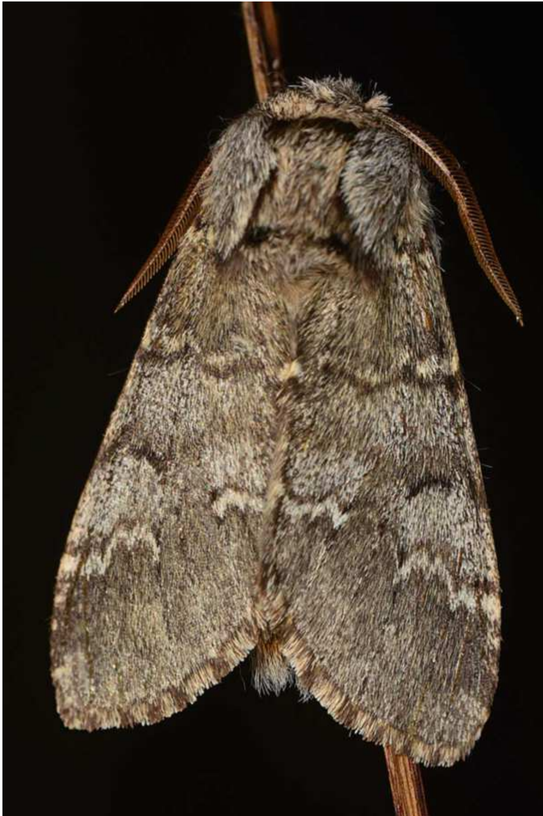
Drymonia ruficornis (Hufnagel, 1766)