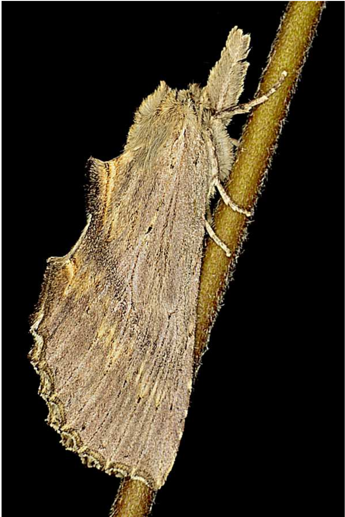
Pterostoma palpina (Clerck, 1759)