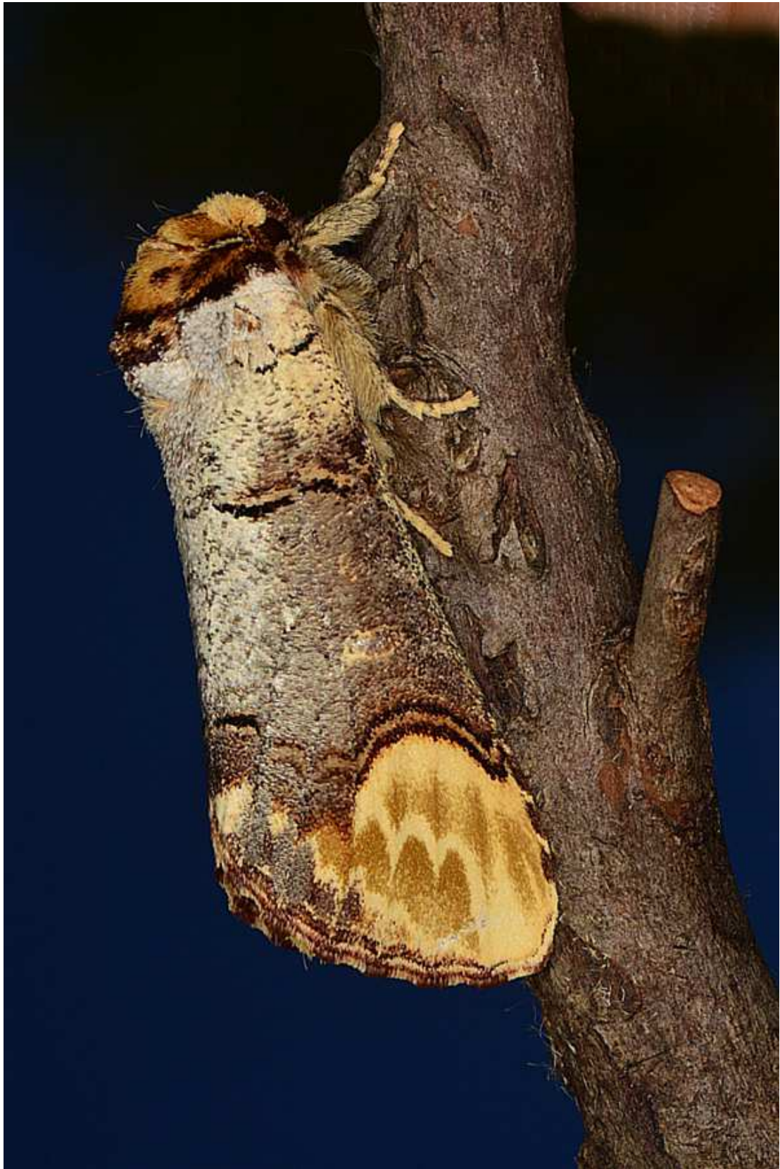
Phalera bucephala (Linné, 1758)