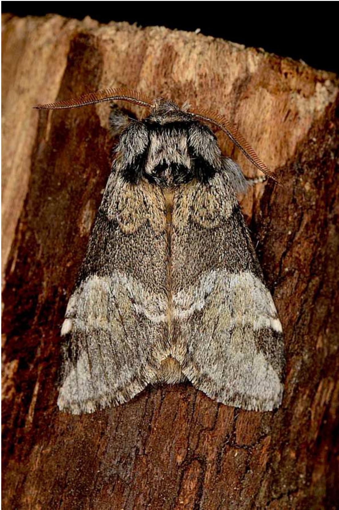
Drymonia dodonaea (Denis & Schiffermuller, 1775)