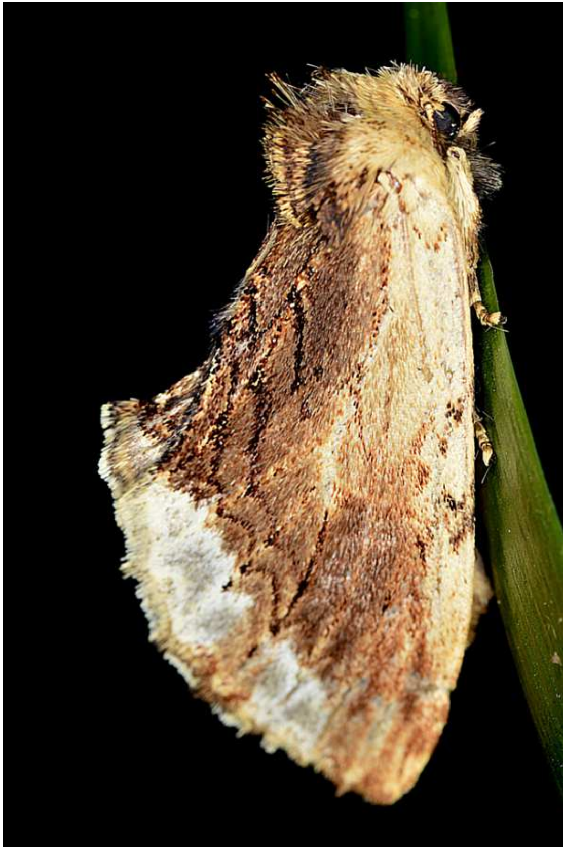
Ptilodon cucullina (Denis & Schiffermuller, 1775)