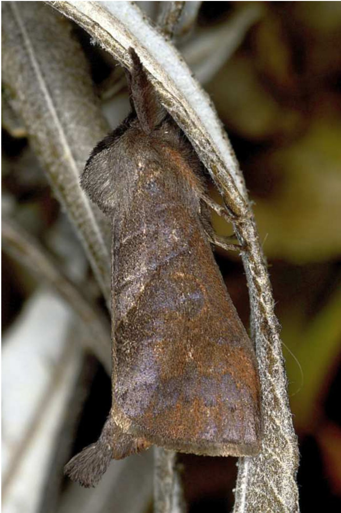
Clostera anastomosis (Linné, 1758)