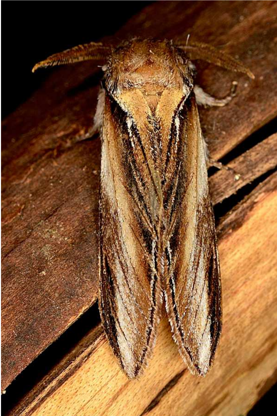
Pheosia tremula (Clerck, 1759)